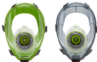
Maschere intere BLS 5400 - BLS 5150